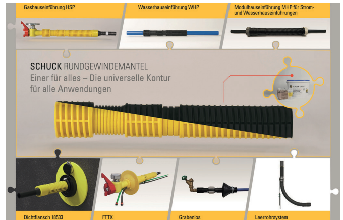
Bild 2: Das Schuck Einbausystem greift wie ein Puzzle ineinander und bietet so das passende Material für einen sicheren und normkonformen Einbau aller Medien

Das Einbausystem ist immer dasselbe, die Montage verläuft immer gleich, der Monteur muss keine speziellen Besonderheiten beachten, der Einbau ist immer sicher und normkonform.