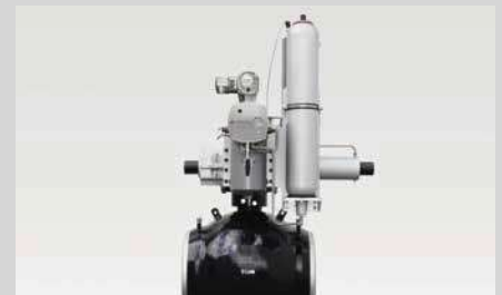
Kugelhahn Typ G