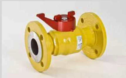
Kugelhahn SK (Überflur)